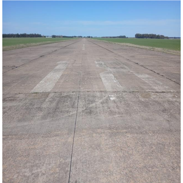
IMAGEN N° 2