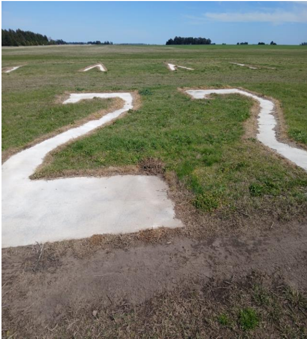
IMAGEN N° 5

ORGANISMO: DIRECCIÓN REGIONAL CENTRO – AREA AERODROMOS AERODROMO: TRES ARROYOS – (YOS – SAZH) ASUNTO: INSPECCION DE AERODROMOS y RELEVAMIENTO GPS FECHA: 08 de septiembre de 2025