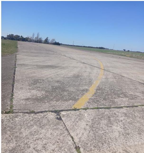
IMAGEN N° 7