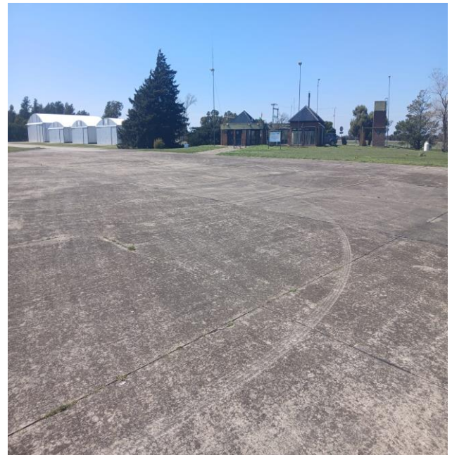
IMAGEN N° 8