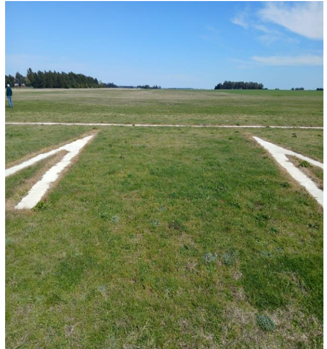
IMAGEN N° 6